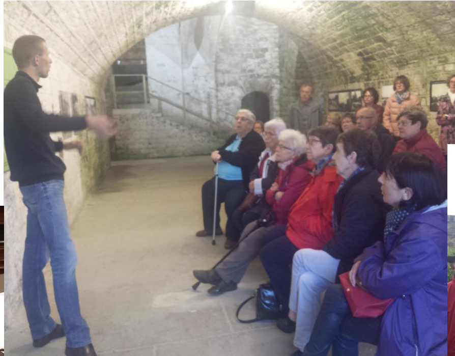
La Mansarde Golbey