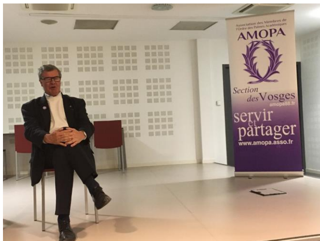
Au restaurant d'application du lycée hôtelier d'Epinal